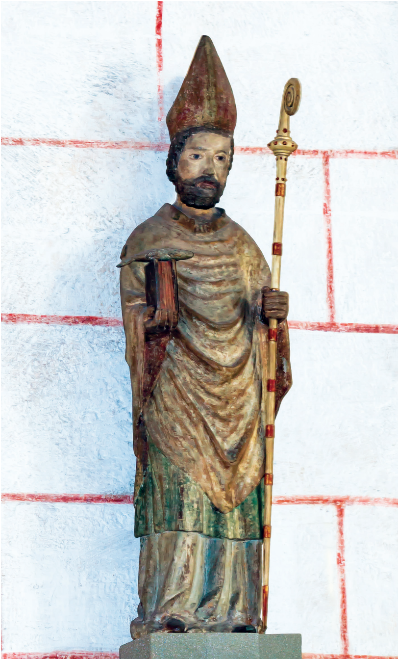
Abb. 1: Heiliger Ulrich, Skulptur um 1330/60, südlicher Pfeiler des Ostchores im Augsburger Dom.