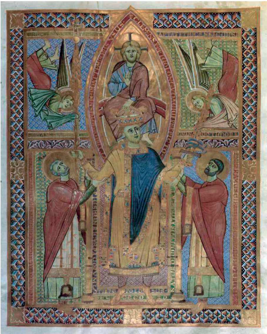
Abb. 2: Bischof Ulrich (links) stützt Kaiser Heinrich II. bei der Krönung, Sakramentar, Regensburg, 1002/14. Bayerische Staatsbibliothek München, Clm 4456, fol. 11'. Aus: MANFRED WEITLAUFF (Hg.), Bischof Ulrich von Augsburg (890–973). Seine Zeit – sein Leben – seine Verehrung . Festschrift aus Anlaß des tausendjährigen Jubiläums seiner Kanonisation im Jahre 993, Weissenhorn 1993, 33.