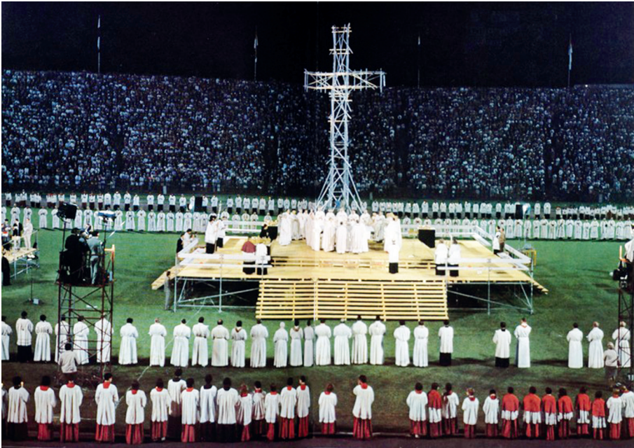
Abb. 6: Ulrichsjubiläum 1973 im Augsburger Rosenaustadion.

Kampf gegen das neue Heidentum des Kommunismus. Erst vor wenigen Wochen war die wieder aufgerüstete Bundesrepublik in das westliche Verteidigungsbündnis NATO integriert worden. In der Auseinandersetzung mit dem Kommunismus setzte man auf den Zusammenschluss des christlichen Abendlandes. Dies wurde besonders deutlich, als der französische Minister Robert Schumann (1886-1963) bei seinem Grußwort im Namen der französischen Regierung und als Sprecher der französischen Katholiken den