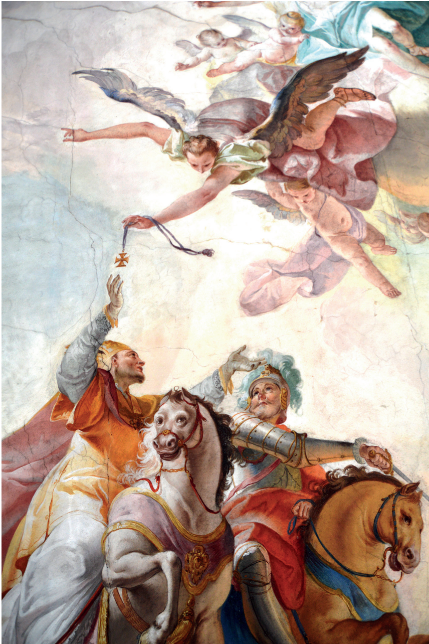
Abb. 4: Bischof Ulrich empfängt in der Schlacht auf dem Lechfeld das Siegeskreuz, Pfarrkirche St. Ulrich in Eresing, Deckenfresko von Franz Martin Kuen, 1757, Detail. Aus: WEITLAUFF, Bischof Ulrich von Augsburg 540.