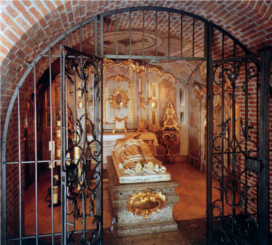
Abb. 5: Ulrichs-Krypta in der Basilika St. Ulrich und Afra in Augsburg.

Nach 50jähriger Bischofstätigkeit verstarb Ulrich mit 83 Jahren am 4. Juli 973. Bischof Wolfgang von Regensburg (972-994) geleitete ihn drei Tage später in der Afra-Kirche zur letzten Ruhe, wo er bereits zu Lebzeiten seine Begräbnisstätte hatte vorbereiten lassen.