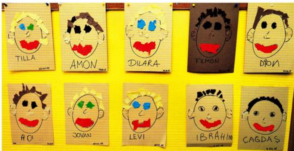
Kitas waren schon immer Orte der Vielfalt.

Bedeutet: Wertschätzung und Akzeptanz menschlicher Vielfalt Alle Kinder sind gleich. Jedes Kind ist besonders.