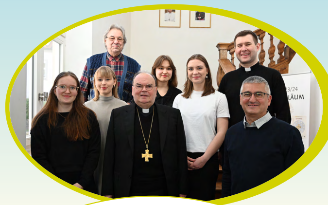
Bild oben: Die Abteilung Weltkirche ist Mitorganisator eines längerfristig geplanten Jugendaustausches mit Estland. Im Bild vier junge estnische Erwachsene zu Besuch in Augsburg.

Bild links: Finanziell unterstützt die Abteilung kleinere Projekte wie im Bild die Verteilung von Lebensmitteln an Familien des Stammes Gabra während einer langen Dürreperiode.