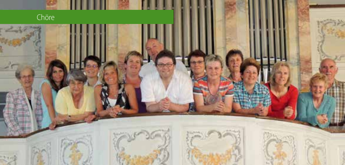
Der Kirchenchor von Dorschhausen auf der Empore der Pfarrkirche Mariä Heimsuchung.