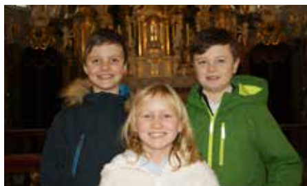
Erstkommunionkinder St. Michael, Stockheim