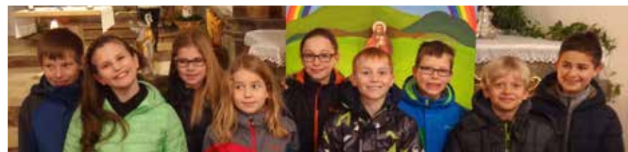
Erstkommunionkinder St. Martin, Schlingen