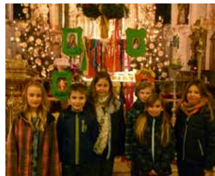
Erstkommunionkinder St. Stephan, Kirchdorf