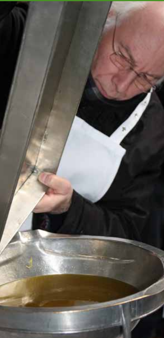
In der Karwoche weicht der Bischof die Heiligen Öle: das Chrisamöl, das Katechumenenöl und das Krankenöl, das beim Sakrament der Krankensalbung verwendet wird. Nach der Weihe werden die Öle in alle Pfarreien der ganzen Diözese gebracht. Die Krankensalbung dient kranken und schwachen Christen zur Stärkung. Sie geht auch auf Jesu Auftrag, Kranken beizustehen, zurück. Diesem Auftrag entspringt auch das Werk der Barmherzigkeit, Kranke zu besuchen.