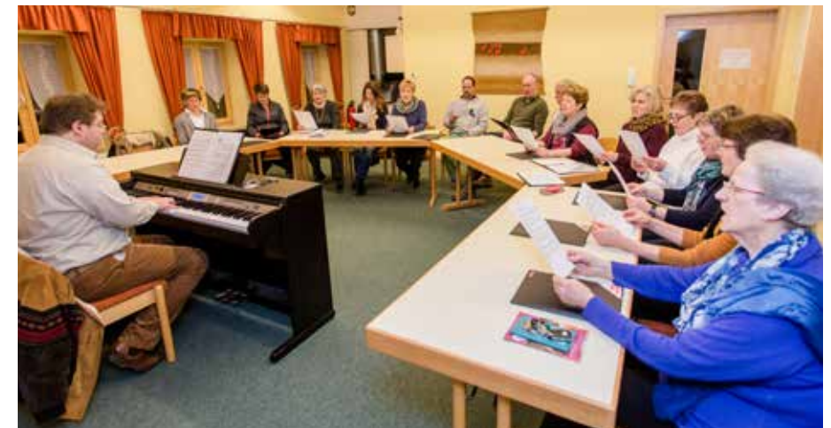
Geprobt wird am Montagabend im Dorfgemeinschaftshaus in Dorschhausen