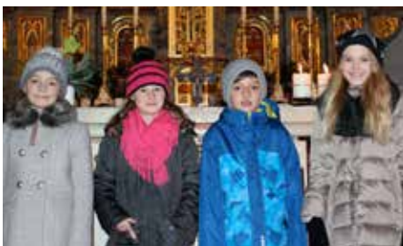
Erstkommunionkinder Mariä Heimsuchung, Dorschhausen