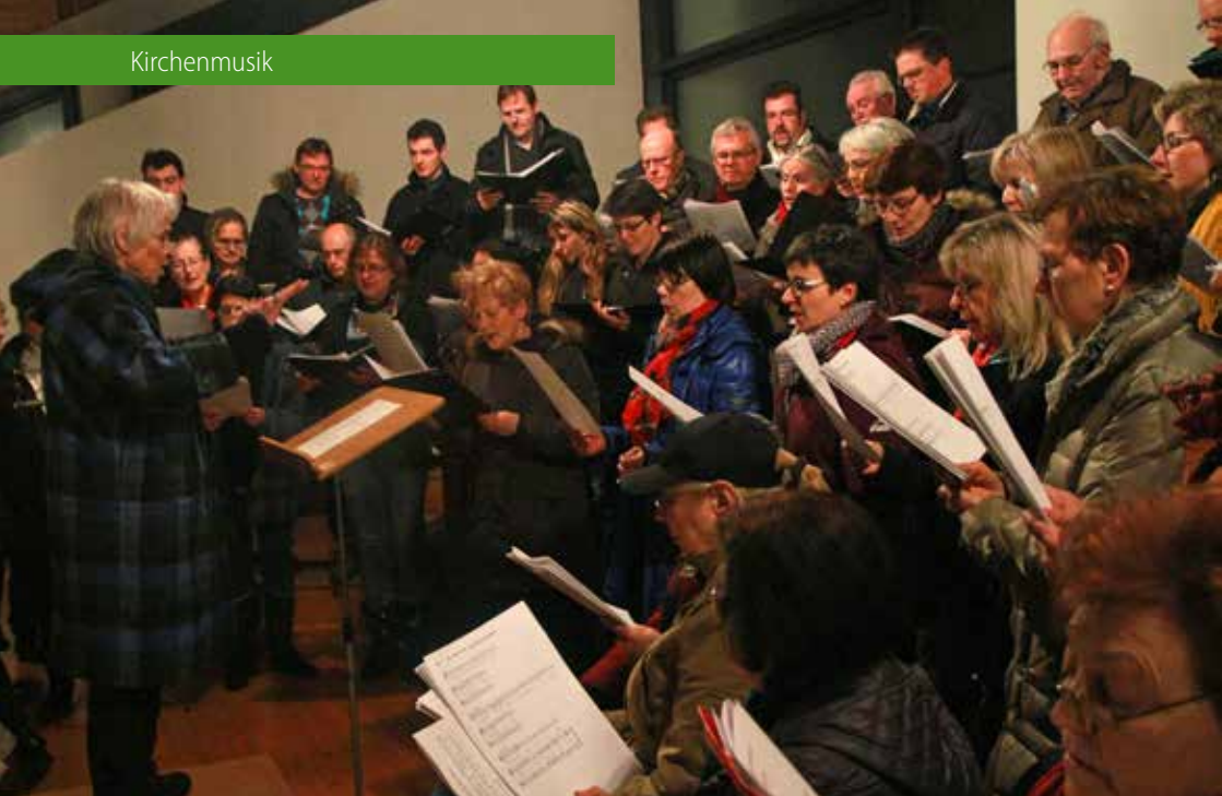
Im vergangenen Jahr musizierten mehrere Chöre der Pfarreiengemeinschaft gemeinsam. An Ostern werden in allen sechs Wörishofer Pfarreien Gottesdienste festlich gestaltet.