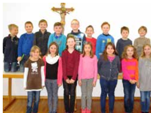
Erstkommunionkinder St. Justina, Bad Wörishofen