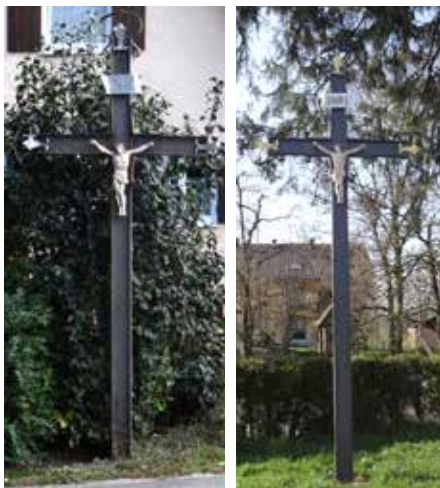
Links: vor der Renovierung, rechts: nach der Renovierung und an einem neuen Platz

Da das Gelände am ursprünglichen Standort etwas abschüssig ist, kostete es jedes Jahr große Mühen, dort einen Fronleichnamsaltar aufzubauen. Deshalb wurde das renovierte Kreuz etwa 20 Meter weiter süd-