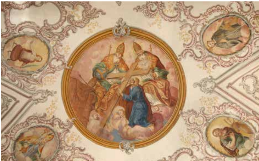
In der Dorschhauser Pfarr- und Wallfahrtskirche Mariä Heimsuchung gibt es eine ungewöhnliche Darstellung des Heiligen Geistes als Person.