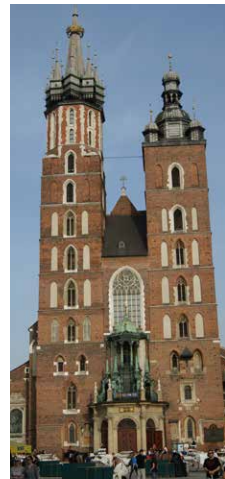
Genau ein Jahr vor dem WJT wurde an der Marienkirche auf dem Marktplatz in Krakau eine große digitale Uhr in Gang gesetzt, die die verbleibende Zeit bis zu diesem Großereignis sekundengenau herunterzählt.

Die rund eine Million Teilnehmer werden zum Abschluss die Nacht auf dem „Campus misericordiae“, dem „Feld der Barmherzigkeit“, verbringen. Als Höhepunkt folgt am nächsten Morgen eine Heilige Messe mit Papst Franziskus. Nach diesen sicherlich strapaziösen und erlebnisreichen Tagen wird die Gruppe einen Erholungstag in Südpolen einlegen, bevor sie am 2. August den Heimweg antritt. Für alle Daheimgebliebenen bieten die Jugendlichen aus Bad Wörishofen einen besonderen Service an: Gegen eine Spende von mindestens fünf Euro schreiben sie eine Postkarte aus Krakau an jede gewünschte Adresse. Kartengrüße können für sich selbst bestellt werden oder als originelle Aufmerksamkeit für einen lieben Menschen, die nette Nachbarin, einen guten Freund oder vielleicht für die kranke Tante. Aufträge und Spenden nimmt das Pfarrbüro bis Freitag, 22. Juli, zu den üblichen Öffnungszeiten entgegen.