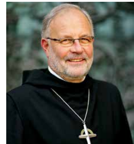
Erzbischof Wolfgang Öxler OSB