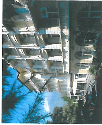
Kolping Hotel in Meran

Das Amt für Kirchenmusik des Bistums Augsburg bietet vom 29.06. - 02.07. 2017 einen NGL-Workshop in Meran an. Eingeladen sind alle Chorleiterinnen und Chorleiter sowie interessierte Sängerinnen und Sänger, die gerne Neue Geistliche Lieder singen. Wir werden während dieser Tage in dem sehr schön gelegenen Kolpinghotel zu Gast sein.