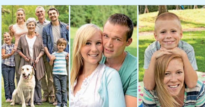
© fotolia.com (2) Bistum Augsburg/Ulrich Berens

Wir sind 14 Referenten /-innen an den Außenstellen des BSA, die Paare, Familien und Alleinerziehende begleiten. Die Fachstellen NFP/MFM und Alleinerziehende finden Sie an der Diözesanstelle.