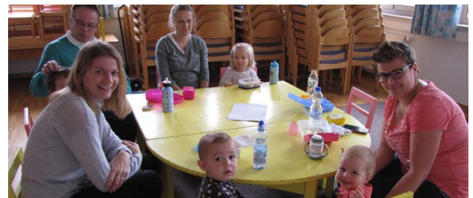
Krabbelgruppe beim Frühstück in St. Justina