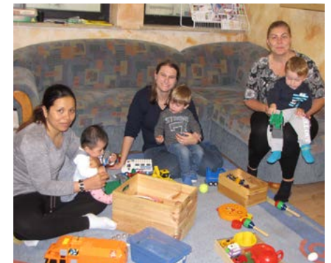
Die Spiel- und Krabbelgruppe in St. Ulrich