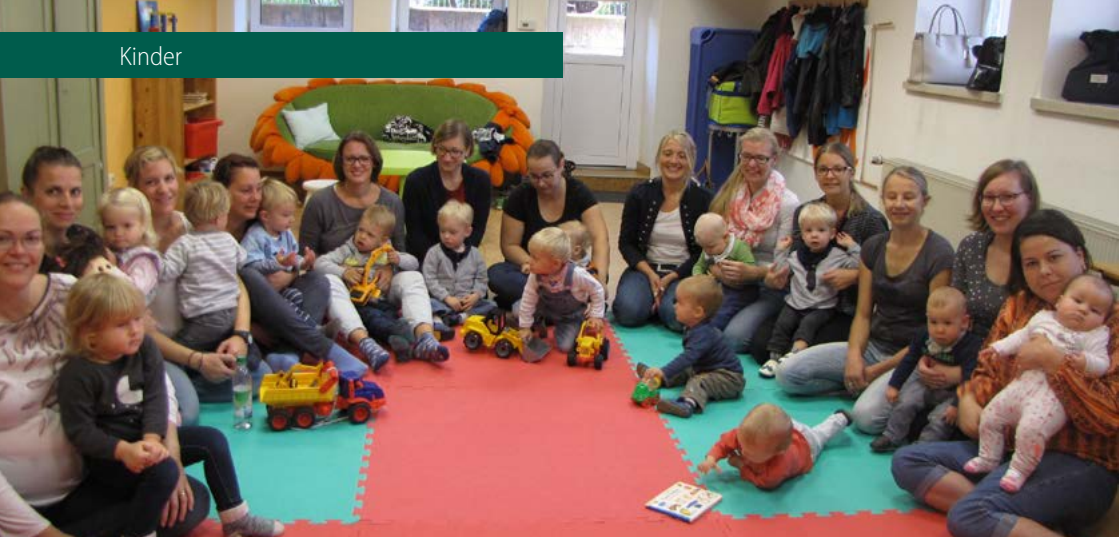
Treff der Spiel- und Krabbelgruppe in Stockheim