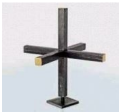
Christuskreuz 2017, P. Abraham Fischer OSB