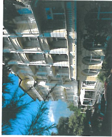
Kolping Hotel in Meran

Das Amt für Kirchenmusik des Bistums Augsburg bietet vom 04.07. - 07.07.2019 den alljährlichen NGL-Workshop in Meran an. Eingeladen sind alle Chorleiterinnen und Chorleiter sowie interessierte Sängereinnen und Sänger, die gerne Neue Geistliche Lieder singen. Wir werden während dieser Tage in dem sehr schön gelegenen Kolpinghotel zu Gast sein.