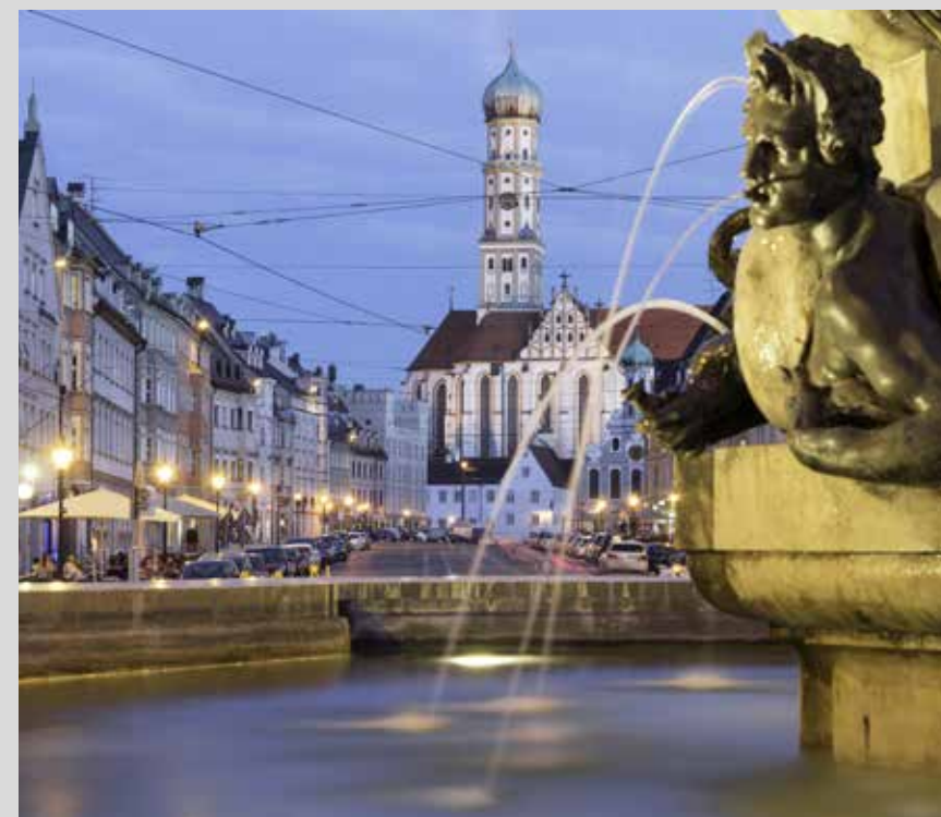
Ziel auf der Brunnentour: Herkulesbrunnen in Augsburg

Brunnentour durch die Augsburger Innenstadt. Treffpunkt ist der Manzubrunnen am Königsplatz. Der Rundgang dauert ca. eineinhalb Stunden. Anschließend Treffen in einem Biergarten oder Café.m