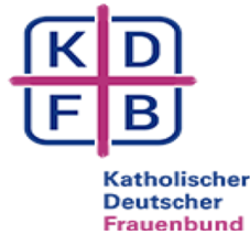
Angelika Kölbl Verbraucherservice