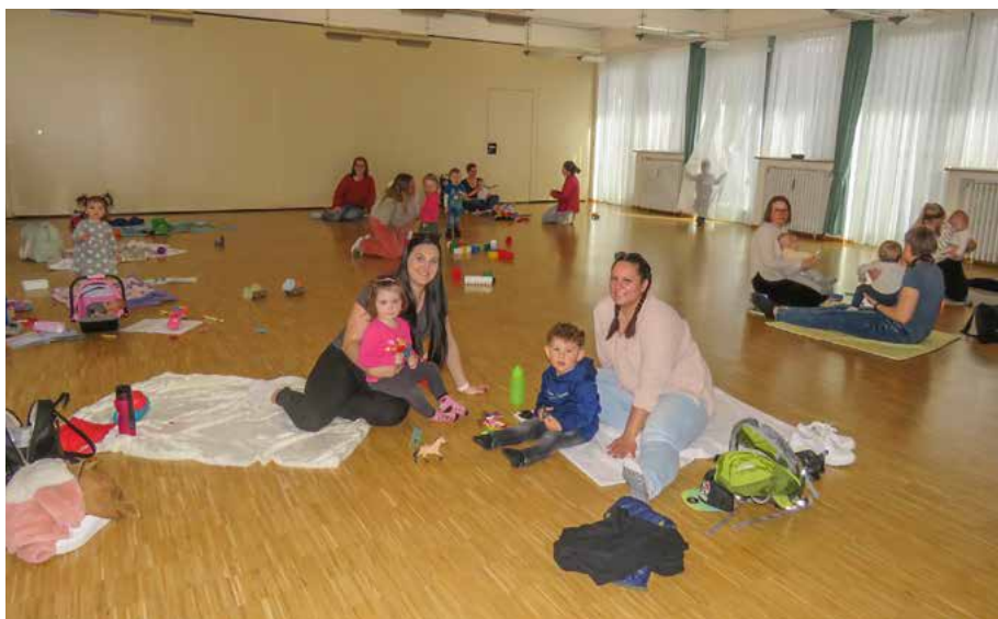
Die Krabbelgruppe für Kinder bis zu drei Jahren trifft sich jeden Mittwoch im Pfarrzentrum von St. Ulrich.