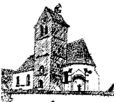
St. Quirin – Staudheim