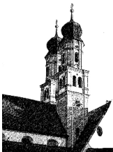
Mariä Himmelfahrt Niederschönenfeld