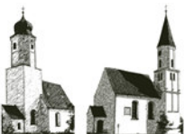
St. Jakobus – St. Georg Unterpeiching Mittelstetten