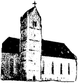
St. Peter und Paul Genderkingen