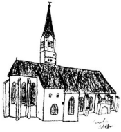
St. Johannes d. Täufer Rain