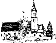
St. Georg – Feldheim