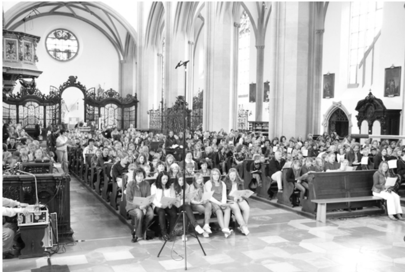
Eine große Sängerschar füllte beim Kinderchortag den Riesenraum der Basilika St. Ulrich und Afra in Augsburg mit Liedern zur Ehre Gottes

Unter dem Motto „Kinder singen ihren Glauben“ ist am 2. Juli 2011 mit dem ersten diözesanen Kinderchortag im Bistum Augsburg die Ulrichswoche eröffnet worden. Gut 550 Kinder aus über 30 verschiedenen Chören sind am Samstag nach Augsburg gekommen und sangen nach einer gemeinsamen Probe unter der kundigen Leitung des Kirchenmusikers der Basilika St. Ulrich und Afra, Peter Bader, im Gottesdienst mit dem Augsburger Bischof Dr. Konrad Zdarsa zur Ehre Gottes. Er sagte in seiner Predigt zu den Kindern und Jugendlichen: „Wenn ihr ‚euren Glauben singt‘, dann seid ihr vom Heiligen Geist geführt. Etwas Besseres könnt ihr nicht tun.“