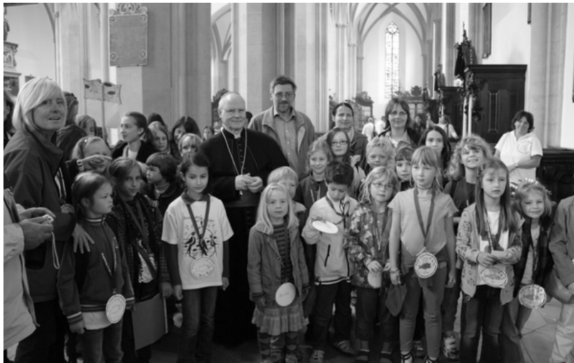
Bischof Dr. Konrad Zdarsa mit Kindern der Chöre aus Bernried und Mauerstetten

Zum Abschluss des Tages kamen nochmals alle Chöre in der Basilika St. Ulrich und Afra zu einer Andacht mit dem Bischöflichen Referenten für Kirchenmusik, Weihbischof Josef Grünwald, zusammen, bei der Schüler der Augsburger Grundschule "Vor dem roten Tor" unter der Leitung von Rektor Franz Guggenberger das Leben des heiligen Bischofs Ulrich in drei Szenen darstellten.