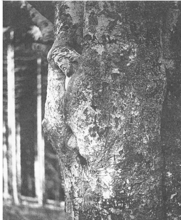
(Balzer-Herrgott, eingewachsener Christus über der Gutachschlucht im Hochschwarzwald)