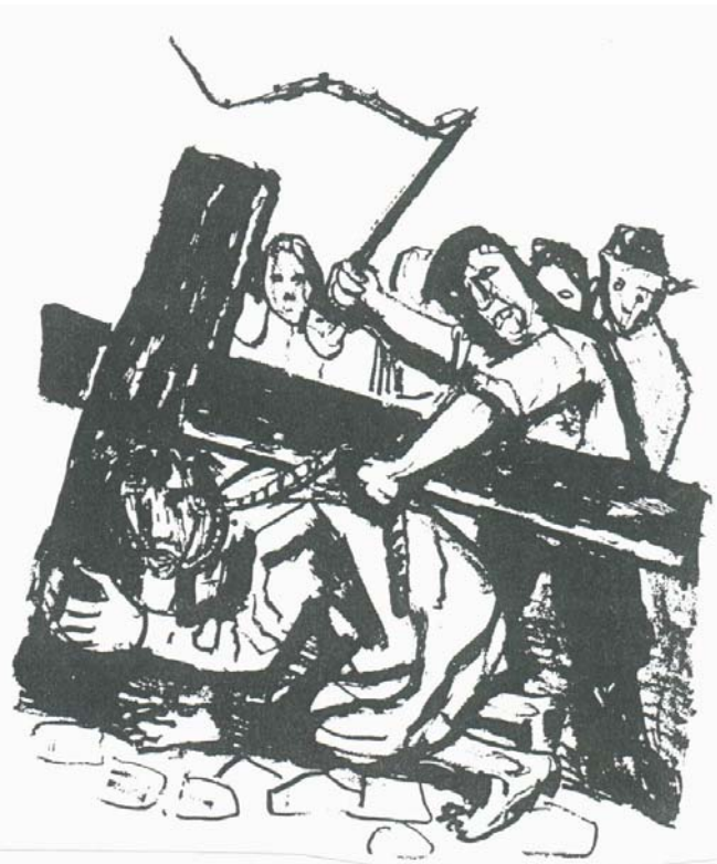
(Otto Dix – Lithographie zu Mt 27, 31-32)