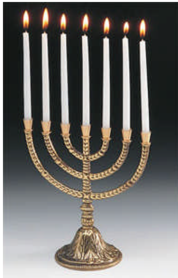
Menora aus Messing

Die Menora ist das älteste jüdische Symbol und erinnert an den siebenarmigen Leuchter im Tempel zu Jerusalem. Sie verkörpert mit ihren zum Himmel gereckten Armen eine Gebetshaltung und ist ein Symbol für Licht und Leben. Ein siebenarmiger Leuchter stand bereits in der Stiftshütte und war später im Tempel Salomons zu finden. Nachbildungen der Ur-Menora, die im 2. Buch Mose beschrieben ist, gibt es in vielen Formen und Materialien, Silber und Gold werden ebenso verwendet wie Messing. Häufig sind sie mit Symbolen für die zwölf Stämme Israel verziert. Ein weiteres oft anzutreffendes Motiv zum Schmuck der Menora ist der Lebensbaum, der Schutz und Zuflucht symbolisiert, aber auch für Wachstum, Kraft und neues Leben steht.