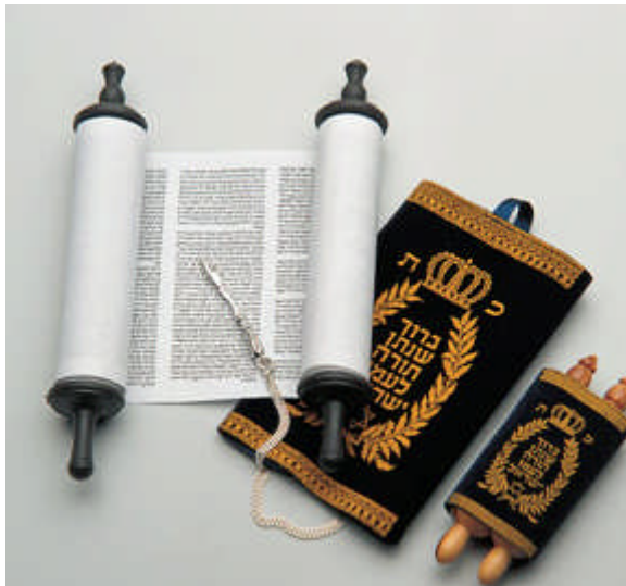
Mini-Tora-Rolle Tora-Mantel , bedruckt „Jad“ Zeigefinger mit Kette (ca. 40 cm)

Die Kippa , auch Jarmulke genannt, ist die traditionelle Kopfbedeckung der Männer im jüdischen Gotteshaus und an anderen Heiligen Orten. Auch beim Beten oder Rezitieren von Segenssprüchen bedeckt man sein Haupt mit diesem Käppchen. Obgleich von den Weisen niemals gesetzlich festgelegt, geht der Brauch, nicht unbedeckten Hauptes zu gehen.